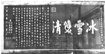
▲民國十三年(公元1924年),海軍上將、福建省長薩鎮冰贈“冰雪雙清”匾,紀念黃乃模。